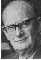
Arthur C. Clarke